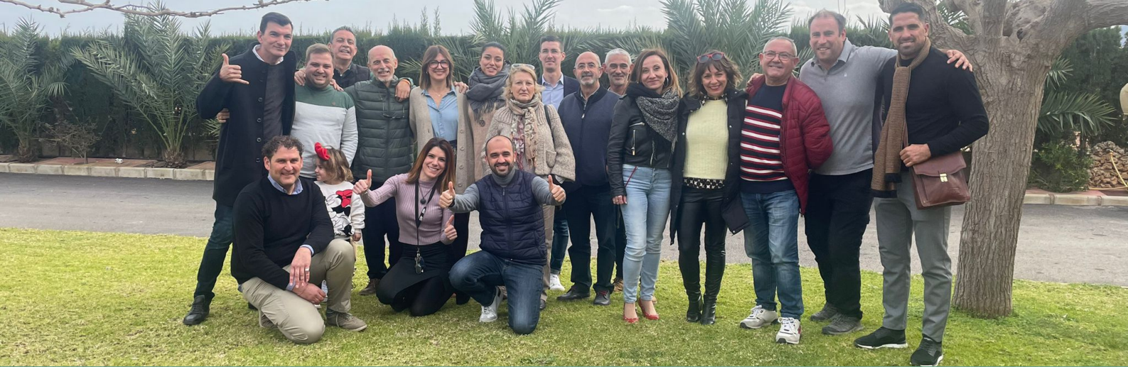
Fotos del encuentro de Networking con la Asociación AESEC