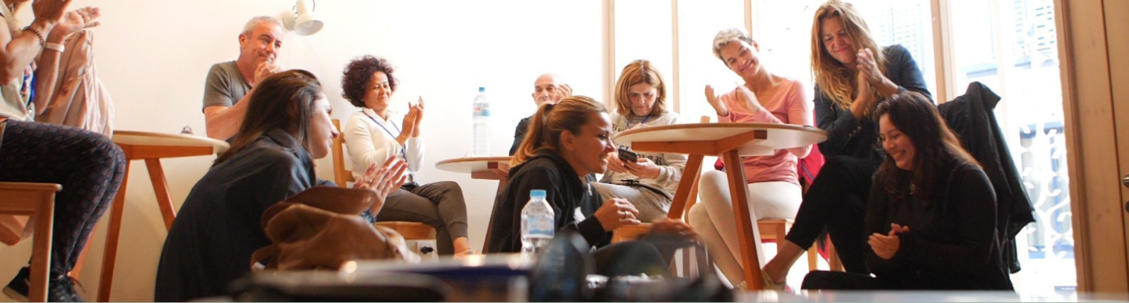
Fotos del encuentro de liderazgo con empresas de Neting APP