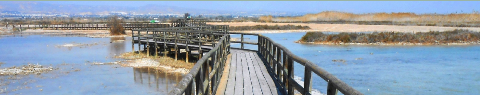
Foto Parque Natural de El Hondo